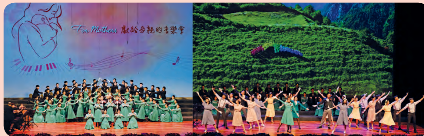
玉山希望藉由音樂、舞蹈的力量，表達對母親、對台灣的感恩珍惜。

回顧整場「For Mothers～獻給母親的音樂會」，透過玉山合唱團的精彩演出，唱出了許多異鄉遊子的心聲與想望，讓所有受邀參與的貴賓、玉山人和家人均深刻感受到玉山對於母親親恩的感念之情，以及知福、惜緣、感恩的心。