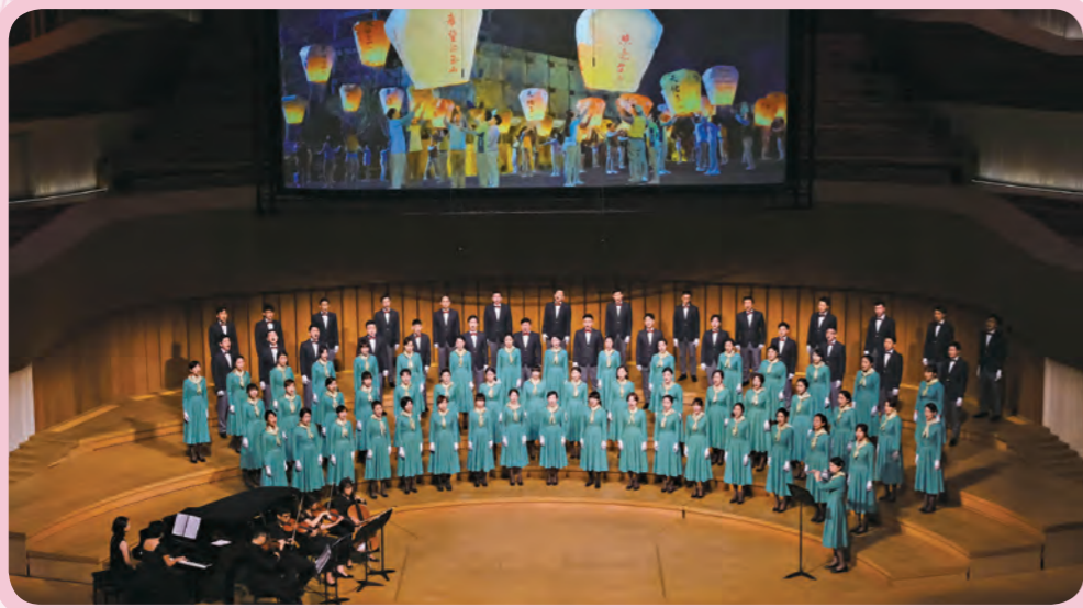
藉由《祈禱》傳達玉山對世界的祝福。