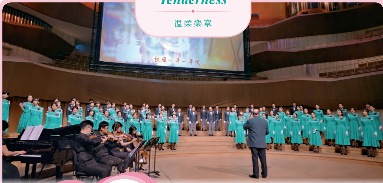
玉山合唱團演唱《回鄉的我》，引人思念故鄉之情。