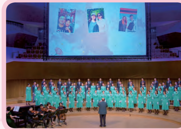
在《天使》的歌聲中，訴說著母愛的偉大。

母親節前夕，在衛武營國家藝術中心所舉辦的「For Mothers～獻給母親的音樂會」，所有貴賓、玉山人及家人一起徜徉在玉山合唱團、六龜高中合唱團及魏廣皓爵士樂團帶來的音樂饗宴。不時可看見與會嘉賓隨著音樂輕擺身體、附