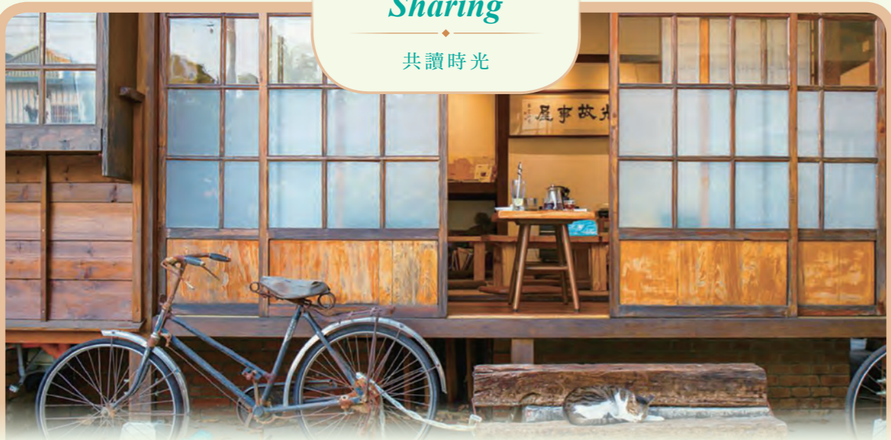
古坑的永光故事屋前身為永光派出所廳舍，現今則已融合了地方故事屋、咖啡館與歷史建物等多項功能。