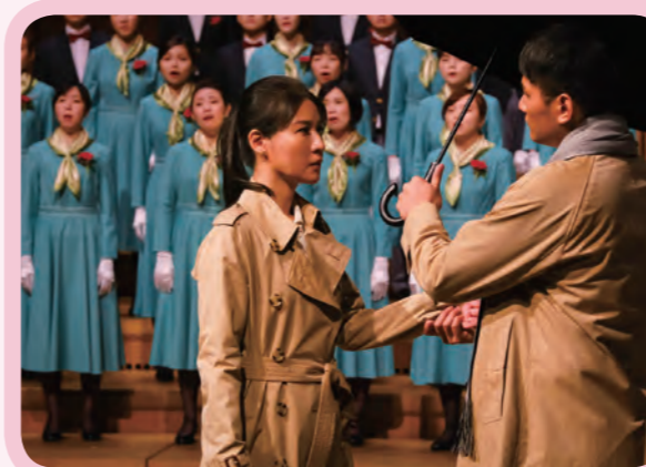
以歌曲與表演的形式傳達玉山對母親的感謝。

高雄衛武營舉辦的「For Mothers～獻給母親的音樂會」從邀請到正式演出期間適逢國內COVID-19疫情升溫，增加顧客出席的不確定性，經由持續對顧客的關心與聯繫，貴賓仍堅持出席音樂會，讓我們衷心感動與感謝，演出結束後對於整體音樂會演出亦表示非常滿意，尤其在演唱《回鄉的我》時更引發極大共鳴。透過舉辦音樂會不僅展現了玉山感恩的文化，更拉近與顧客間的情感！