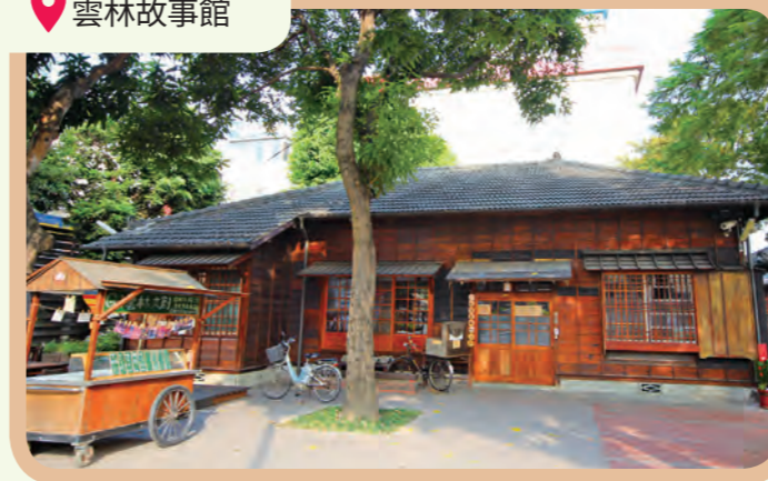
雲林故事館迄今已培育400多位素人創作者、催生100多本原創繪本，長期透過圖畫及文字挖掘且記錄著與在地相關的故事。