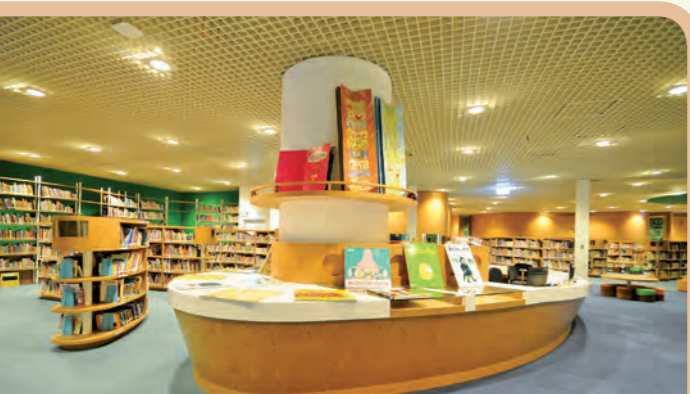
高雄國際繪本中心

高雄國際繪本中心共有中文書6萬餘冊，外文館藏更超過8萬冊，集結了11種語言、28個國家的童書繪本。