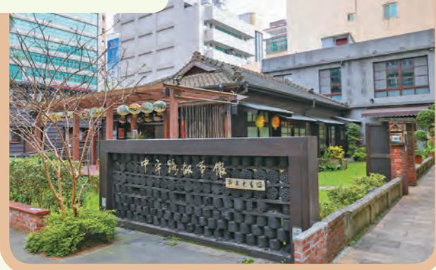
地處繁華巷弄內的中平故事館，處處呈現著過往的生活痕跡。