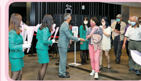
音樂會結束時，玉山人將代表祝福的康乃馨獻給貴賓。