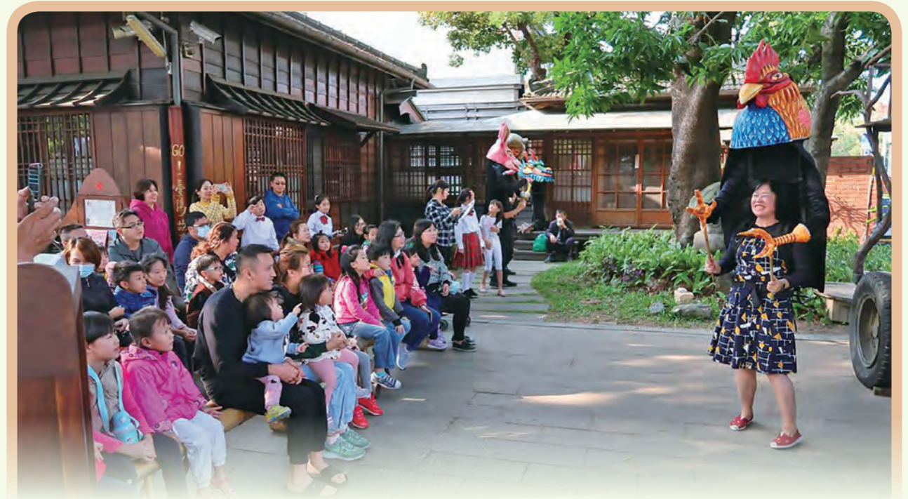
玉山文教基金會與雲林故事人協會合作推動《爬一座故事山》系列活動，希望透過故事串連台灣生活經驗與文化價值，並勾勒出在地文化的樣貌。

充滿日式典雅風格的基隆要塞司令官邸落成於1931年，經修復後仿如時空重置般，再次展現昔日官邸的大氣風華。目前是由基隆市文化局與民間書店共同策劃推出「時光繪本書屋」，除了做為在地的繪本基地，還有歐亞5國特色古蹟書店主題展、韓國繪本書展及逾千本的繪本童書，加上建築空間定期導覽、互動式表演、親子工作坊等藝文活動，成為親子共讀的絕佳場所。