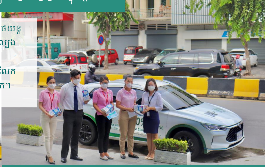
ព្រឹត្តិការណ៍ការបើកបររថយន្តសាកល្បងនៅអគារ E.SUN

នៅក្នុងឆ្នាំ2021 យើងបានសហការជាមួយក្រុមហ៊ុនលក់រថយន្តអគ្គិសនីដើម្បីបង្កើតព្រឹត្តិការណ៍ ការបើកបររថយន្តសាកល្បងសម្រាប់បុគ្គលិករបស់យើង។ យើងនឹងព្យាយាមឲ្យបានល្អក្នុងការផ្សព្វផ្សាយ និងចែករំលែកទស្សនៈការពារបរិស្ថានជាមួយប្រជាជនទូទាំងពិភពលោក។