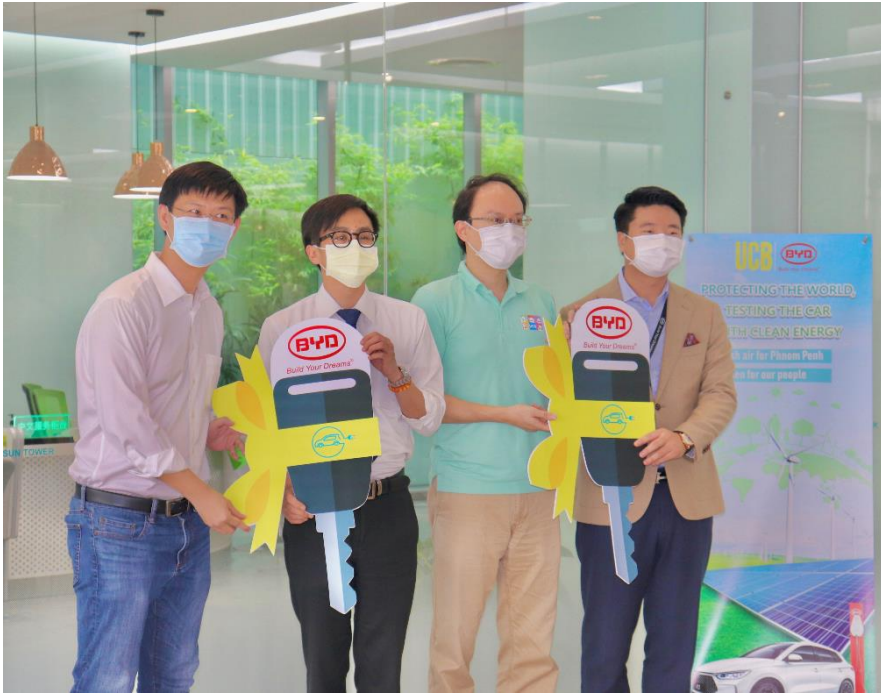
ការទិញរថយន្តអគ្គិសនីចំនួនពីរគ្រឿងសម្រាប់ប្រើប្រាស់ក្នុងស្ថាប័ន

កត្តា ESG (បរិស្ថាន សង្គម និង អភិបាលកិច្ច) គឺជាអ្វីដែលយើងតែងតែយកចិត្តទុកដាក់ខ្ពស់។ រថយន្តអគ្គិសនីនឹងដើរតួនាទីយ៉ាងសំខាន់នាពេលអនាគត ពីព្រោះវាអាចជួយកាត់បន្ថយការបំពុលខ្យល់នៅក្នុងបរិស្ថាន និងសន្សំសំចៃថាមពលធ្វើឲ្យការរស់នៅរបស់យើងកាន់តែប្រសើរ។