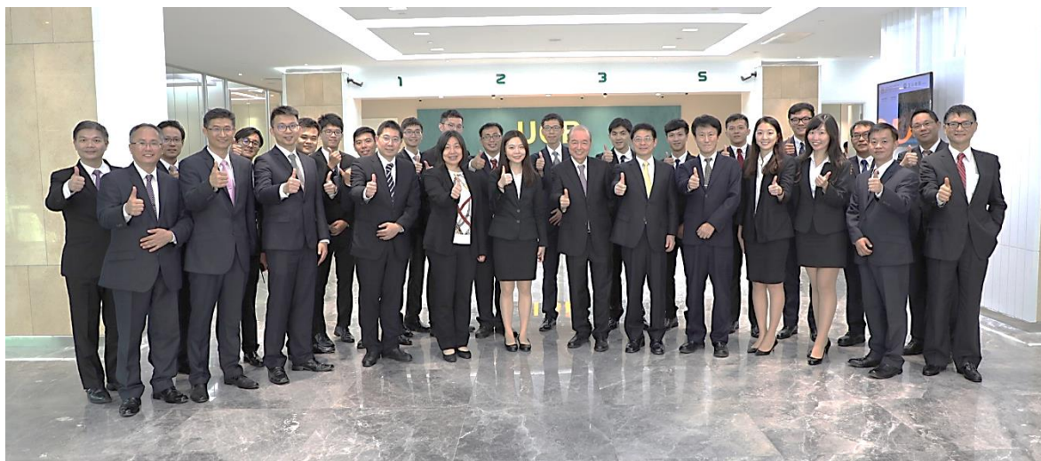
ស្ថាបនិកនៃ E.SUN FHC ជាមួយគណៈគ្រប់គ្រងប្រារព្ធពិធីសម្ពោធនៃការកណ្តាលថ្មីរបស់ធនាគារ UCB