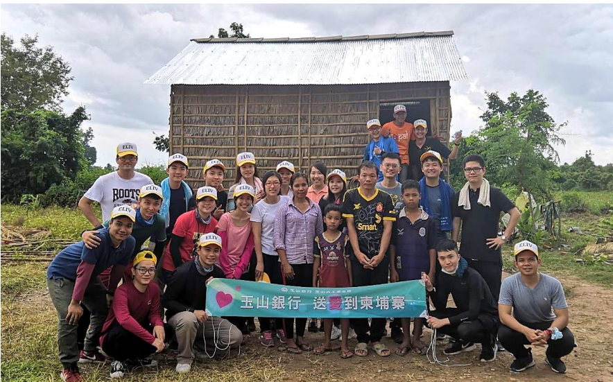
ព្រឹត្តិការណ៍អ្នកស្ម័គ្រចិត្តឆ្នាំ 2018 ជាមួយធនាគារអ៊ីសាន់ នៅក្នុងខេត្តសៀមរាប