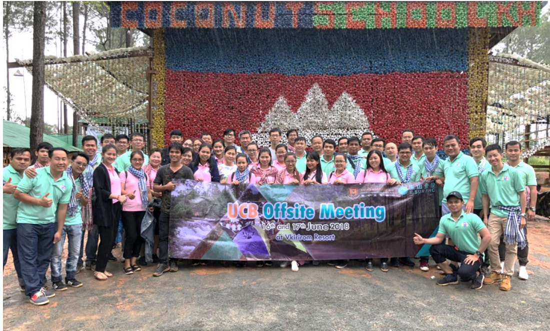
នាយកប្រតិបត្តិដឹកនាំក្រុម UCBers ដើម្បីសំអាតបរិស្ថាននៅតាមខេត្តដាច់ស្រយាល